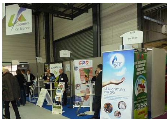
Une partie de l'espace Partenaires

Sur le salon, vous avez aussi pu retrouver nos partenaires Koppert, Vilmorin et Hortimax.