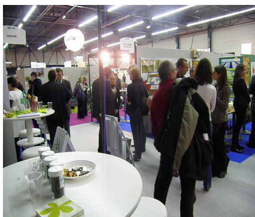
Mercredi 18 janvier, les partenaires recevaient les producteurs de légumes de France à l'occasion d'un cocktail sur l'espace commun